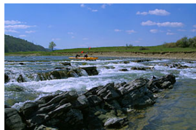
UKRAINA – rzeka Stryj 72,7 km - 2.05.2007 r.