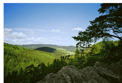
CZECHY – dolina Wełtawy