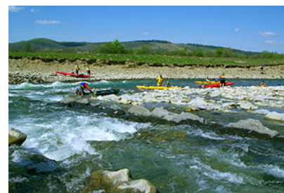
UKRAINA – rzeka Stryj 72,7 km - 2.05.2007 r.

Towarzystwo Polska-Litwa-Łotwa-Estonia ma w imprezach udział informacyjny i doradczy. Za ostateczny kształt wypraw odpowiedzialni są wyłącznie prowadzący imprezy i ich uczestnicy, z których każdy bierze