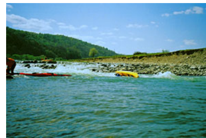
UKRAINA – rzeka Stryj 72,7 km - 2.05.2007 r.

Prowadzący udzielają szczegółowych informacji o imprezach. Oni też prowadzą zapisy i zbierają wpłaty – mają w tym celu stosowne pełnomocnictwa Zarządu Towarzystwa PLŁE.