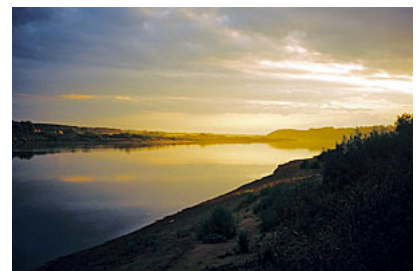
Niemen w Średnikach