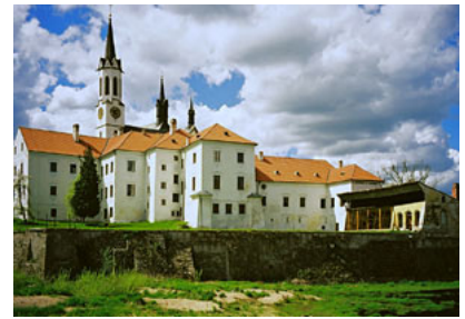
CZECHY – Wysoki Bród - klasztor - 5.05.2004 r.

Spływ będzie się odbywał w oparciu o stałą bazę noclegową w Czeskich Budziejowicach – ten dodatkowy koszt będzie zależał od wariantu (domek albo własny namiot).