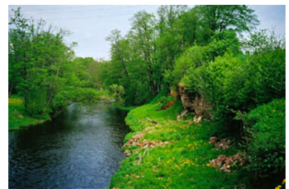
Vaidava na Łotwie 27 km od Must - 12.08.2007 r.