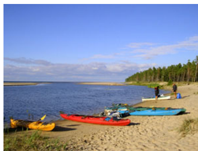
ŁOTWA – ujście Irbe do Bałtyku