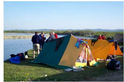
UKRAINA – rzeka Stryj 59,5 km

Prowadzący nasze imprezy dążą do tego aby dobrze się przygotować pod każdym względem do prowadzenia spływu na nieznaną często trasie. Dla ewentualnych donosów dotyczących incydentalnych przypadków odbiegających od tej reguły Zarząd naszego Towarzystwa zawsze chętnie „nadstawi ucha”. Mechanizm ten podwyższa gwarancje jakości imprezy, na którą zawsze największy wpływ mają i tak jej uczestnicy, więc to od nich przede wszystkim zależy jak świetna jest zabawa, bo zabawa jest zawsze.