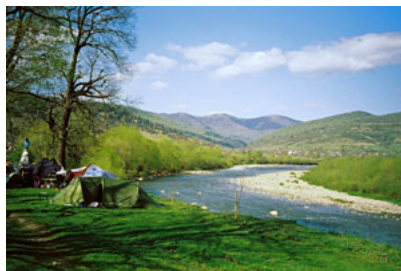
UKRAINA – rzeka Stryj 84,5 km - 2.05.2007 r.