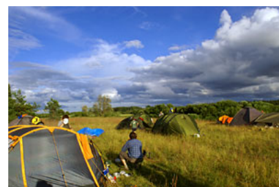
Estonia – nad rzeką Must 8,5 km od Gauji