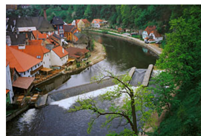
CZECHY – rzeka Weltawa z wyżyn zamku w Czeskim Krumlowie