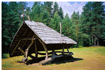
LITWA – Auksztocki Park Narodowy