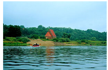
Niemen w Sapieżyszkach - 7.08.2006 r.