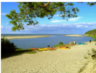
ŁOTWA – ujście Irbe do Bałtyku