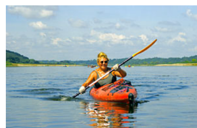
Litwa – Niemen pod Raudaniem