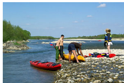
UKRAINA – rzeka Stryj 64 km - 2.05.2007 r.