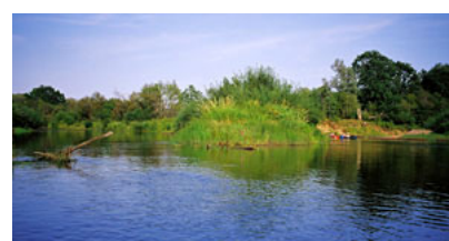
Ujście Must do Gauji - 250,3 km