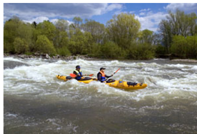
SŁOWACJA – rzeka Orava 11 km