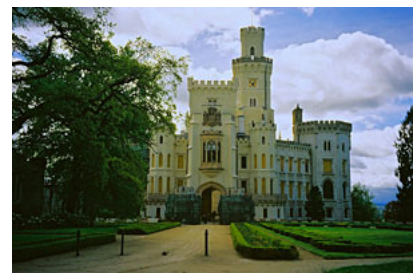
CZECHY – Hluboka - zamek - 7.05.2004 r.