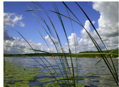
ESTONIA – jezioro Võrts

2.05.2007 r.