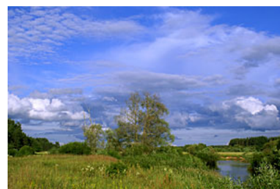
Estonia – nad rzeką Must 8,5 km od Gauji