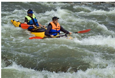
SŁOWACJA – rzeka Orava 11 km